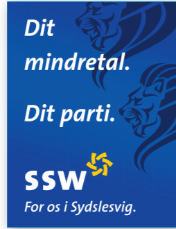
Listenplatz 3 Dennis Guthardt Wahlkreis 4 Süd