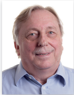
Listenplatz 2 Hermann Paulsen Wahlkreis 5 West